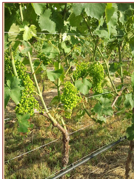
Esempio di sfogliatura eccessiva! Sicuri danni da scottatura sui grappoli a luglio!

Per questo a inizio anno si era suggerito l'utilizzo di tubi forati, che evitano questo fenomeno.