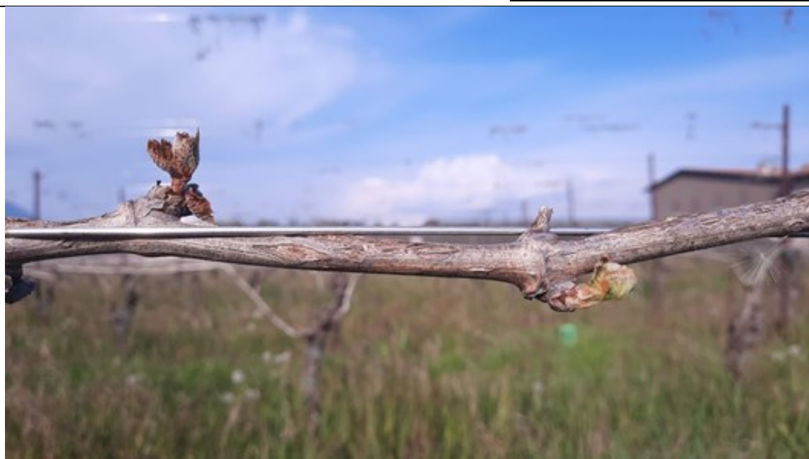
Gemma disseccata (a sx) e vitale, che solo ora ha raggiunto la lunghezza che la sua compagna aveva il giorno della gelata (6 -7 aprile)