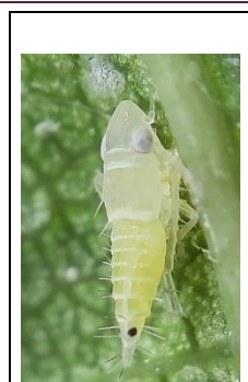
Neanide di Scafoideo fresca fresca: fotografata oggi