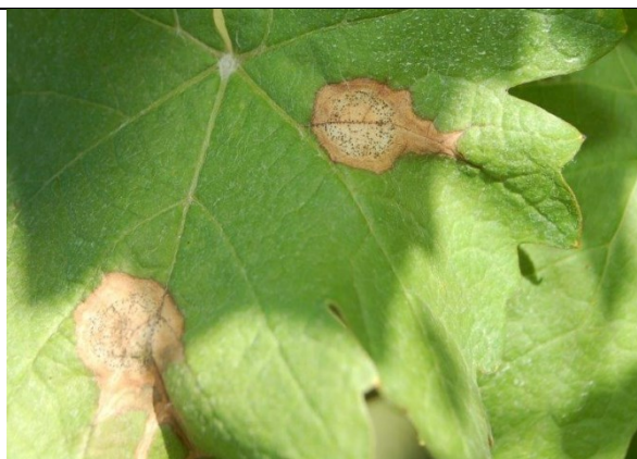
Black rot su foglia

La malattia può essere molto pericolosa se trascurata.